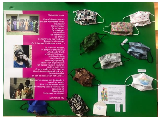
De Ark tijdens corona: mondkapjes maken waarvan de opbrengst bestemd is voor Oeganda

Daarnaast zijn we net als andere kerken mensen gaan bellen, hebben we een WhatsApp-groep