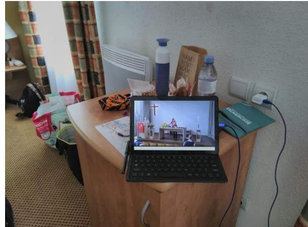
De Ark tijdens corona: Arkers bekijken vanaf hun vakantie-adres de onlineviering